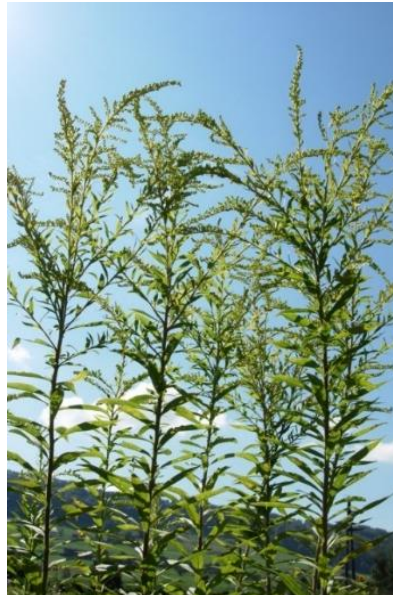
Solidago canadensis

InfoFlora Verbreitungskarte des Aggregats Solidago canadensis aggr. welches folgende Arten enthält: Solidago canadensis L. → Link zur Verbreitungskarte und Solidago gigantea Aiton → Link zur Verbreitungskarte