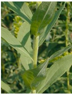
S. canadensis Stängel grün und behaart