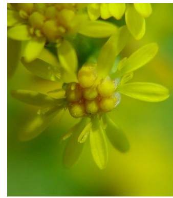
S. gigantea Zungenblüten länger als die Röhrenblüten