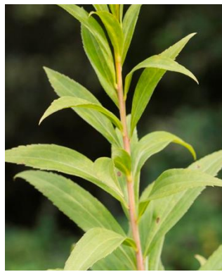
S. gigantea Stängel rötlich und kahl