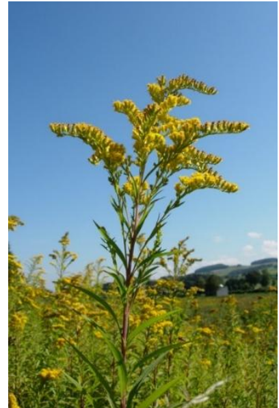
Solidago gigantea