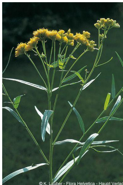
Solidago graminifolia

Link zur InfoFlora Verbreitungskarte von S. graminifolia (L.) Salisb.