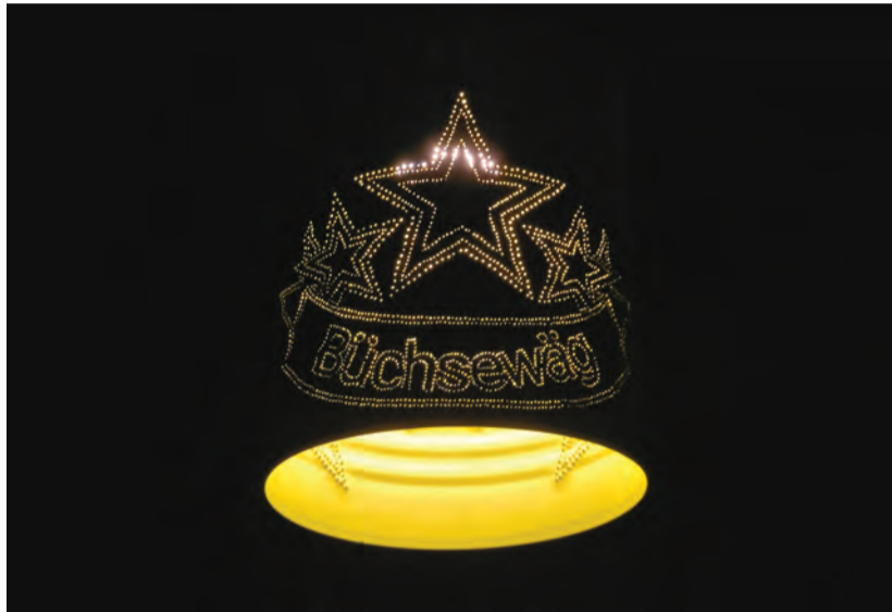
Eine jede ist ein Kunstwerk für sich: Die Büchsen laden zum Staunen ein.