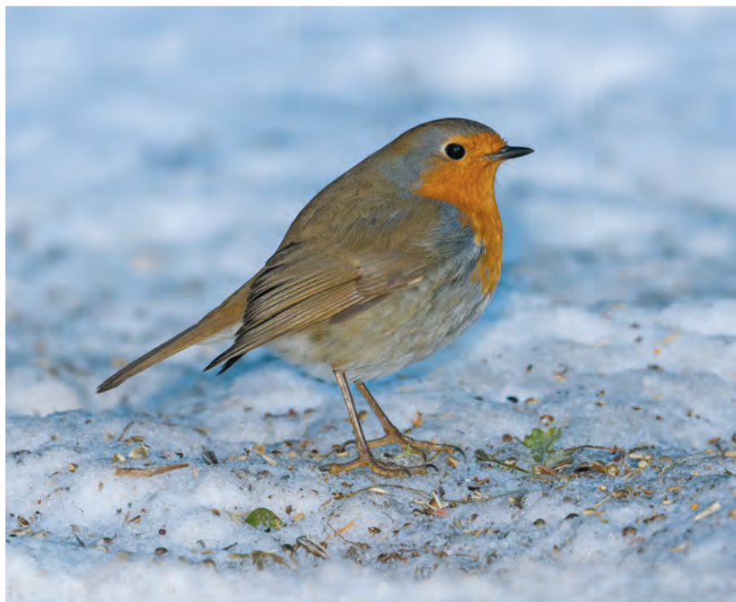
Der Vogel des Jahres 2025: Das Rotkehlchen.