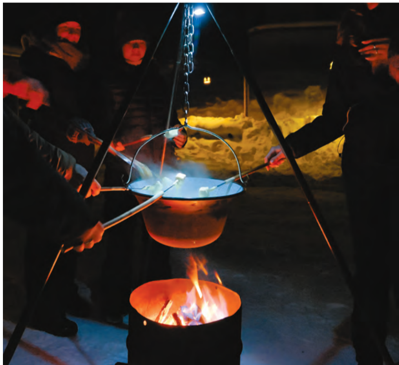
Draussen vor dem Büchsewäg-Beizli gibt's für Gruppen auf Vorbestellung ein feines Fondue über dem Feuer.