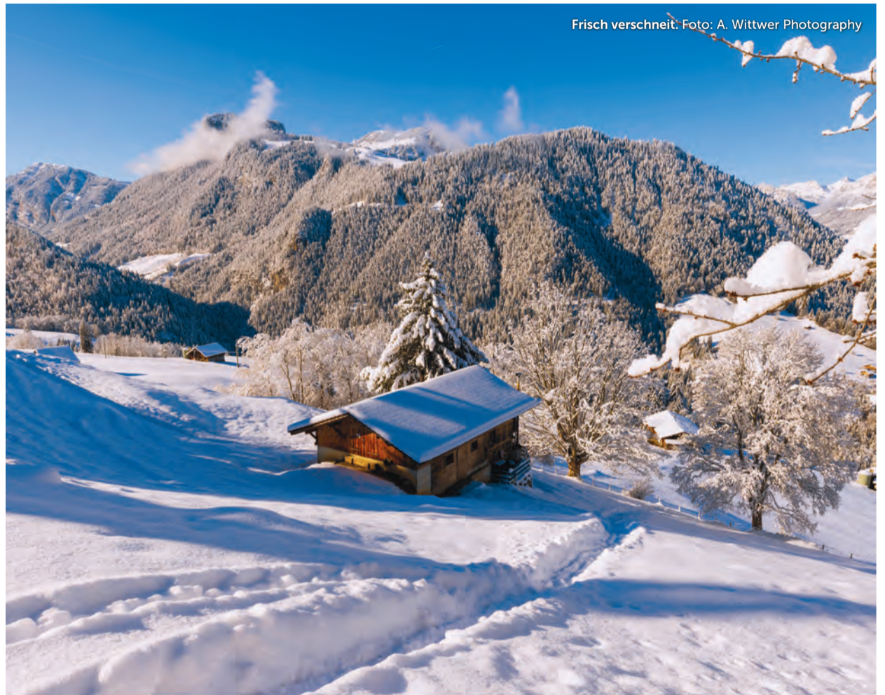
Frisch verschneit: Foto: A. Wittwer Photography