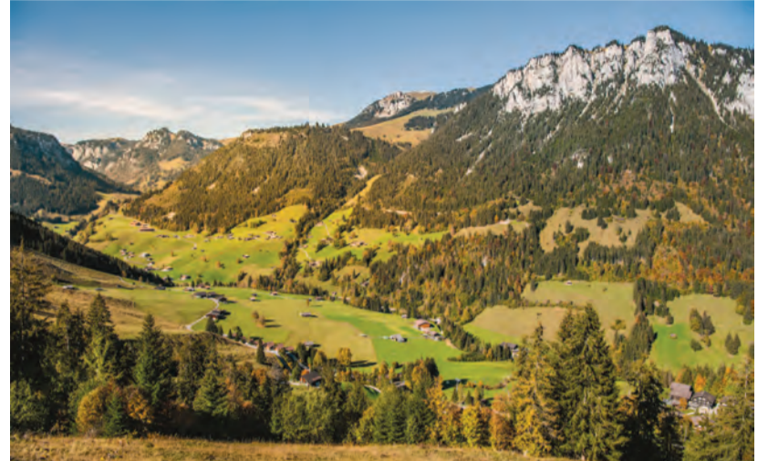
Der Erhalt der für das Diemtigtal charakteristischen Streusiedlung, war 1986 unter anderem Grund für die Verleihung des Wakkerpreises.

Beate Makowsky, Geschäftsführerin, Naturpark Diemtigtal