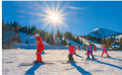
Das Team der Schweizer Skischule Diemtigtal im Einsatz.

Pamela Ulmann und Bruno Allenbach, Schweizer Skischule Diemtigtal, skischule-diemtigtal.ch