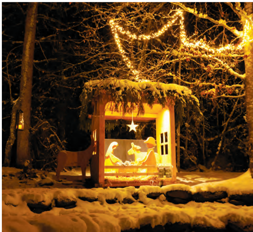
Die hell beleuchtete Waldkrippe bei der Katzenlochbrätelstelle.