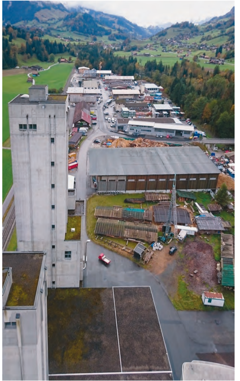
Überblick über das Gewerbegebiet im Burgholz.