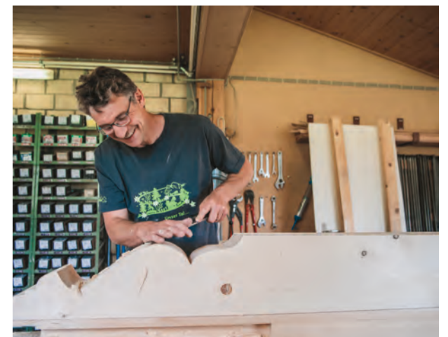
... und neue Produkte entstehen lassen.