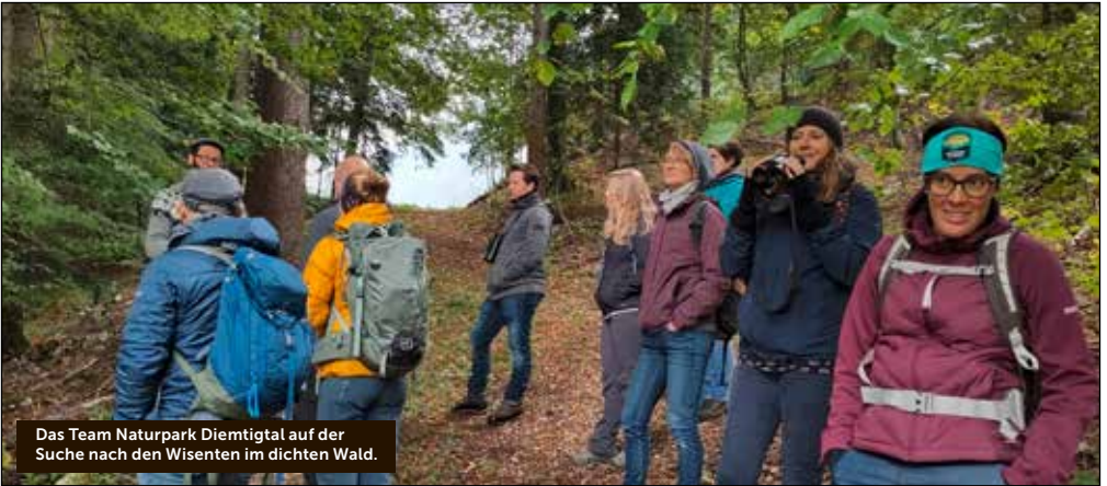
Das Team Naturpark Diemtigtal auf der Suche nach den Wisenten im dichten Wald.