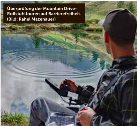
Überprüfung der Mountain Drive-Rollstuhltouren auf Barrierefreiheit.