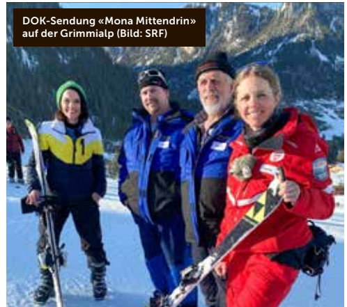
DOK-Sendung «Mona Mittendrin» auf der Grimmialp

wendung mit Smartphones zu optimieren. Die graphisch, technisch und Google-optimierte «neue» Webseite wird vor der Sommersaison 2024 aufgeschaltet werden